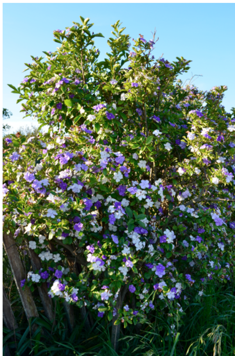
Fotografía 1. Ejemplar de Brunfelsia australis en floración