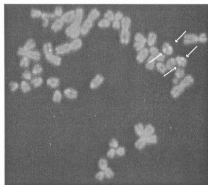
Figura 2. Localización de la señal del gen MCI-R en un cromosoma telocéntrico de tamaño mediano.

Como se puede ver en la figura 2, se observó un aumento de la fluorescencia correspondiente a la señal emitida por el gen MCI-R en las regiones homólogas cercanas al centrómero de un cromosoma telocéntrico de mediano tamaño. De manera provisional, del estudio de estas imágenes se puede inferir que el gen MCI-R puede localizarse en las proximidades del centrómero de los cromosomas 8 ó 9, ya que son los que presentan una morfología telocéntrica y son del tamaño apropiado.