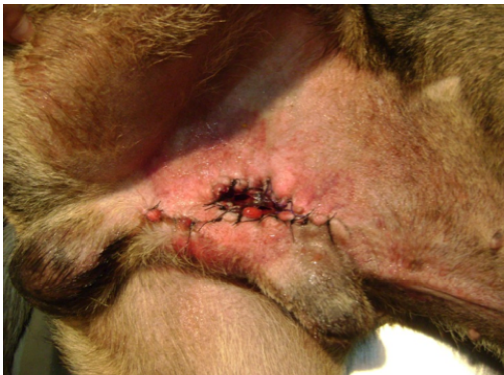
Figura 5 Creación de estoma en caninos