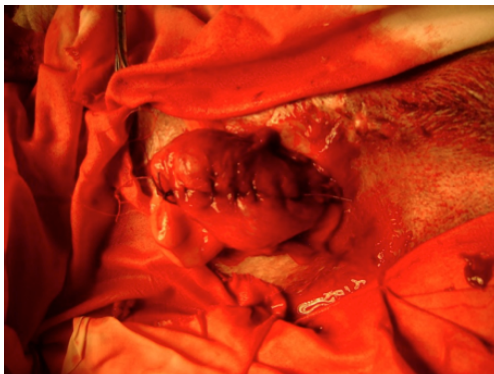
Figura 7 Cierre de la vejiga