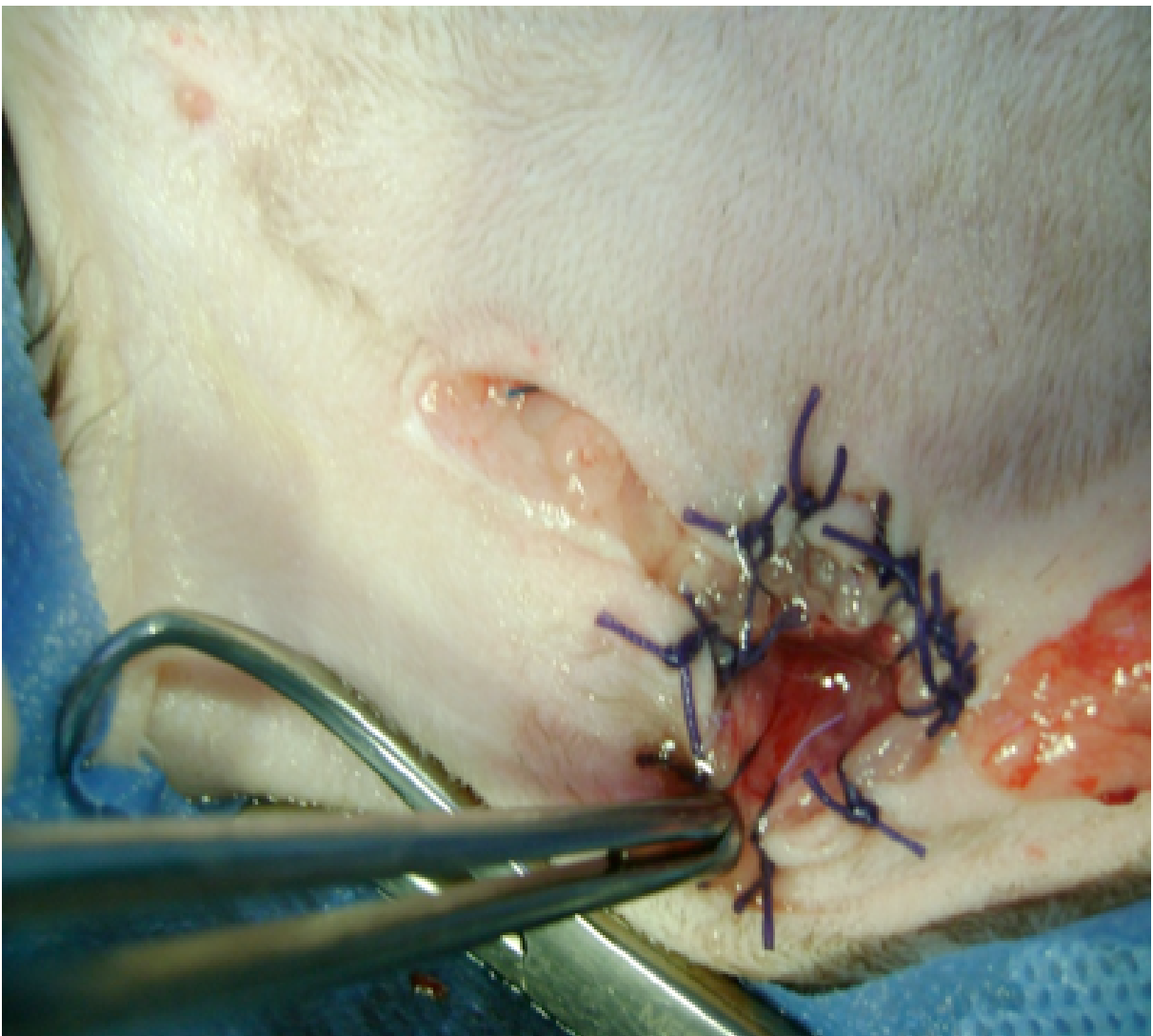
Figura 3 Sutura mucosa vesical a la piel

rar mucosa vesical con piel (Figura 3), con una sutura perforante, a punto interrumpido, con un hilo absorbible 3-0 monofilamento, creándose así el estoma. (Figuras 4 y 5). Se procedió a la sutura de la piel que no involucraba el estoma con puntos simples, de nylon monofilamento 2-0.