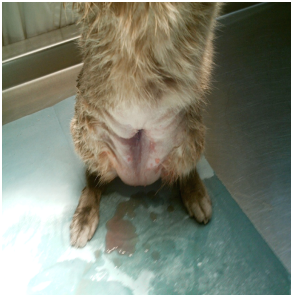
Figura 4 Creación de estoma en felinos