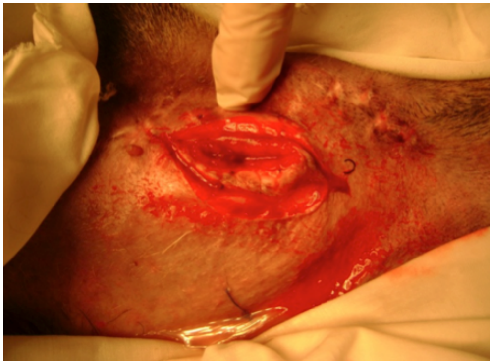
Figura 6 Cierre de él estoma. Incisión de piel, subcutáneo que rodean al estoma.

de la piel (Figura 6). A continuación se incidió el músculo abdominal que estaba unido a la pared de la vejiga, dejando un margen de 3 mm para evitar la lesión de la misma.