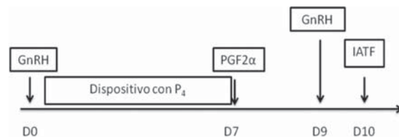
Figura 1. Esquema protocolo CIDR – Synch.

Existe cierta dicotomía de los efectos de la GnRH en la progresión de la onda folicular en los tratamientos de inducción con P 4 (Diskin y col., 2002); siendo cuestionado el uso de la GnRH para sincronizar la emergencia de una onda folicular (Macmillan, 2010); tal vez esta sea la causa de los resultados variables explicados anteriormente. Por esto algunos técnicos se inclinan por la utilización de BE al principio y no GnRH (de Nava, 2011).