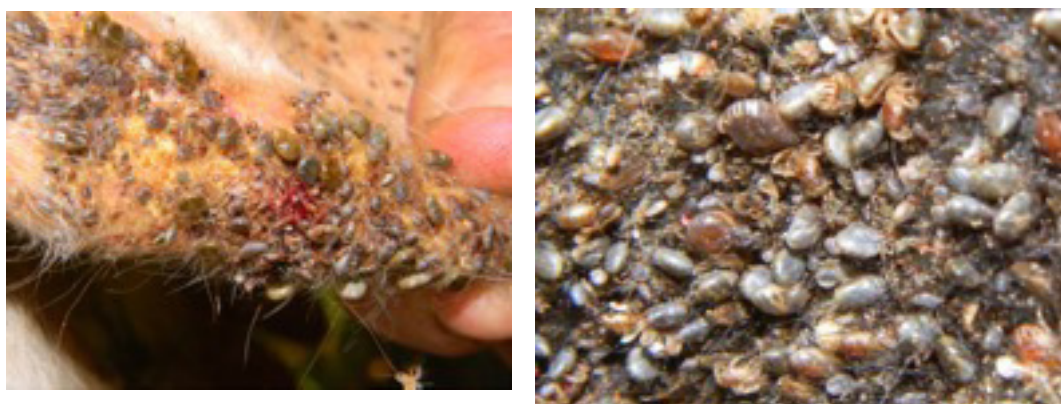
Figura 1. Vista parcial de zonas de piel parasitada con garrapata.