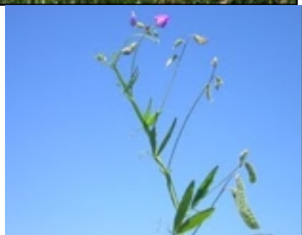
Figura 1. Sessea vestioides . Salto